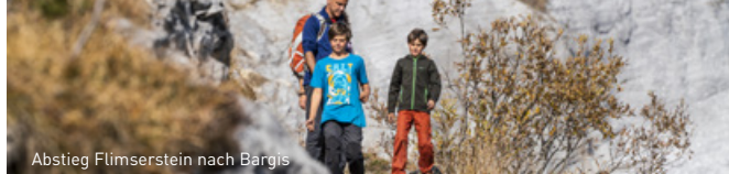
Abstieg Flimsenstein nach Bargis