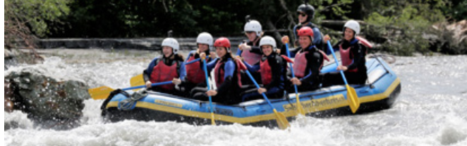
River Rafting in der Rheinschlucht